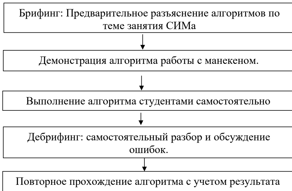
Рис.1. Алгоритм работы в Симуляционно-аттестационном центре.

Самостоятельная работа студентов подразделяется на аудиторную и внеаудиторную (обязательную для всех студентов и по выбору). Внеаудиторная самостоятельная работа подразумевает подготовку по вопросам, не входящим в тематику аудиторных занятий, и включает самостоятельную проработку материала, подготовку и защиту реферата, а также подготовку к текущему и промежуточному контролю (24 часа). Внеаудиторная самостоятельная работа по ряду изучаемых тем представляет собой участие в интерактивной симуляции на платформе дистанционного обучения академии.